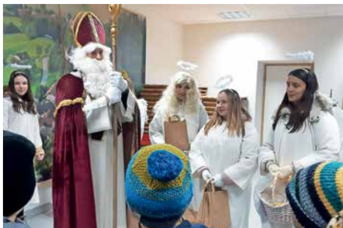
Miklavž v Javorjih