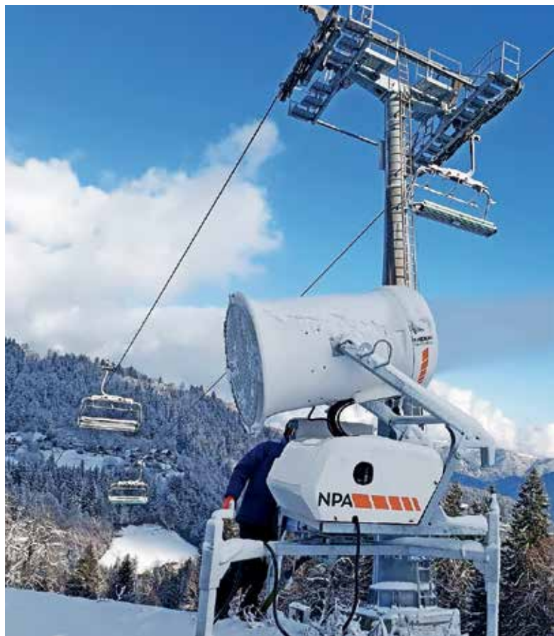
Nova pridobitev na smučišču Stari vrh – snežni top znamke Sherpa

Pogojev za izdelavo tehničnega snega na naši nadmorski višini ni v izobilju, zato moramo te izkoristiti v popolnosti takrat, ko so na voljo. Vse to je mogoče storiti predvsem precej bolje s