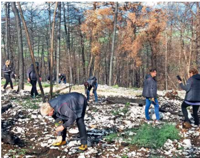
Folklorniki so na Krasu sadili hrastove sadike in želod.