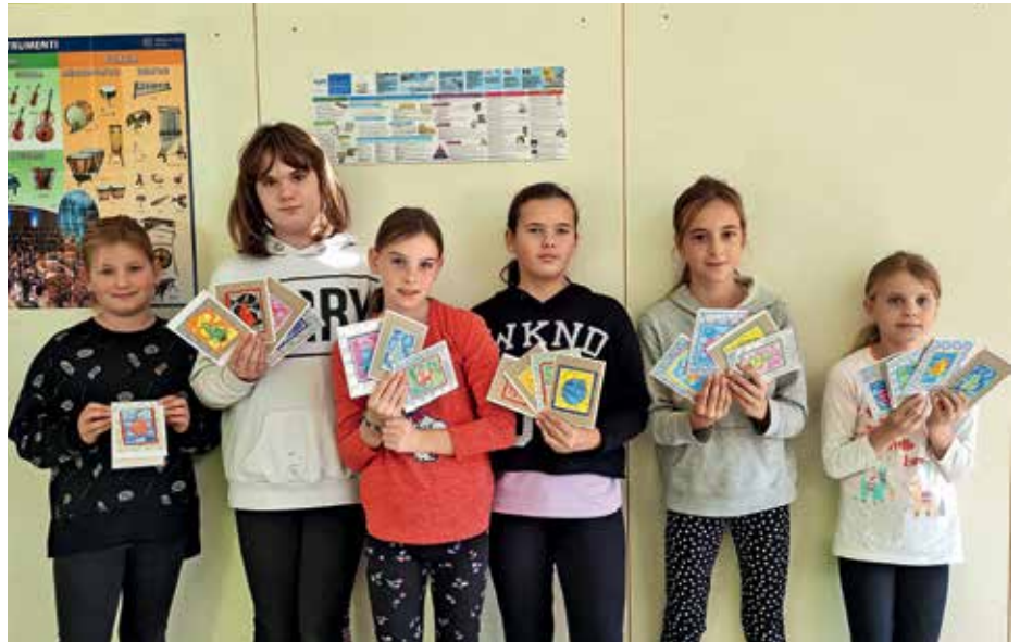
Med jesenskimi počitnicami so učenci izdelovali voščilnice.

Prosto po Prešernu – to je naslov gledališke predstave, ki so si jo ogledali osmo- in devetošolci v Cankarjevem domu v Ljubljani. Igralcem je uspelo osnovnošolcem približati Prešerno-