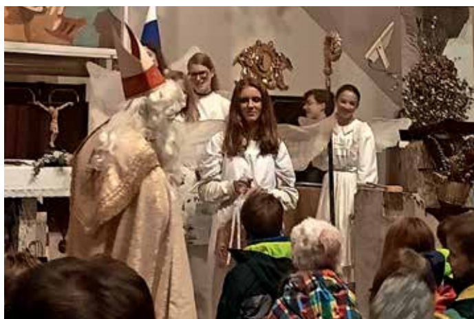
V Poljanah je Miklavž otroke prvič obdaroval v cerkvi sv. Martina.

V Poljanah je Miklavž otroke v starosti od enega do deset let obiskal na predvečer praznika, zbrani otroci in starši so ga tokrat pričakali v župnijski cerkvi svetega Martina. V res polni cerkvi so najprej poslušali igrani odlomek Dobrodelna dražba mladih igralcev KD dr. Ivan Tavčar Poljane. S pomočjo številnih angelčkov in v ozadju slišanim rožljanju parkeljnov so nato že malo zaskrbljeni in vznemirjeni otroci le priklicali Miklavža. S pomočjo angelčkov je razdelil več kot 350 daril. KS Poljane se