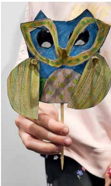
Na ustvarjalni delavnici so nastale sovice Oke.