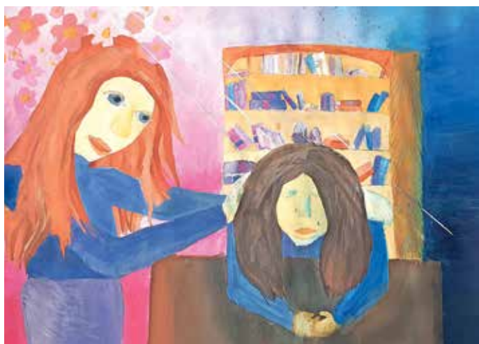
Plakat miru Ajde Stanonik

Kar takoj na prvi decembrski dan se je v šoli začel veseli december, in sicer so otroci, vzgojiteljice in učitelji v popoldanskem času spet pripravili dobrodelni sejem. Po dveh letih premora so na ogled ponovno postavili svoje izdelke, ki so jih zadnji mesec šivali, krasili, zlagali, vezali, ovijali, pekli, zavijali, pakirali ... Pripravili so tudi menjalnico igrač in srečelov.