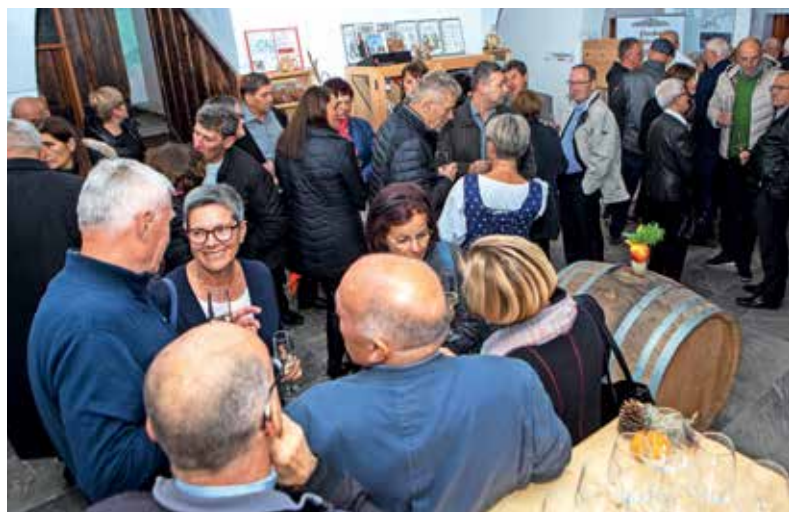
Martinovanje na Dvorcu Visoko

Prihaja zimski čas in zapihal je zadnji jesenski veter, ki je na Dvorec Visoko prinesel jesenske dobrote. Veliko pridelkov je že pobranih in izbira lokalno pridelanega sadja ter zelenjave je še posebno bogata. Zato je jesen pravi čas za pripravo najokusnejših jedi. Ponuja veliko sestavin, med njimi predvsem gobe,