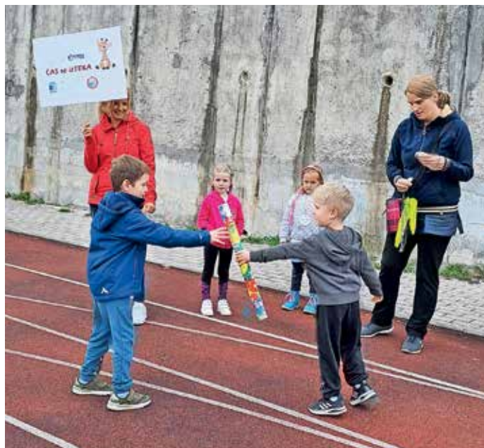
Tudi Vrtec Agata se je pridružil globalni akciji Čas se izTEKa – Running out of Time.

V vrtcu smo vključeni v projekt Eko šola – Eko vrtec. Cilj projekta je izobraževati otroke o ohranjanju našega planeta za naše zanamce. Tako se že več let pogovarjamo in si aktivno prizadevamo za zmanjšanje podnebnih sprememb in s tem posledično prispevamo k ustavitvi segrevanja planeta. V tednu od 17. do 21. oktobra smo bili še bolj aktivni. Z otroki smo organizirali podnebni dan in podpisali listino z obljubo, da bomo pomagali graditi prihodnost, ki je pomembna in trajnostna za vse nas. Organizirali smo štafetni tek, ki je bil del množičnega teka Čas se izTEKa – Running out of Time. Podnebna štafeta je na pot krenila 30. septembra iz Glasgowa na Škotskem, njena pot pa se bo zaključila v Šarm el Šejku v Egiptu na podnebni konferenci COP27. Ker vsak kilometer šteje, smo h globalnemu teku skupno prispevali 3 kilometre in 150 metrov. Ponosni smo, da smo bili del tega dogodka.