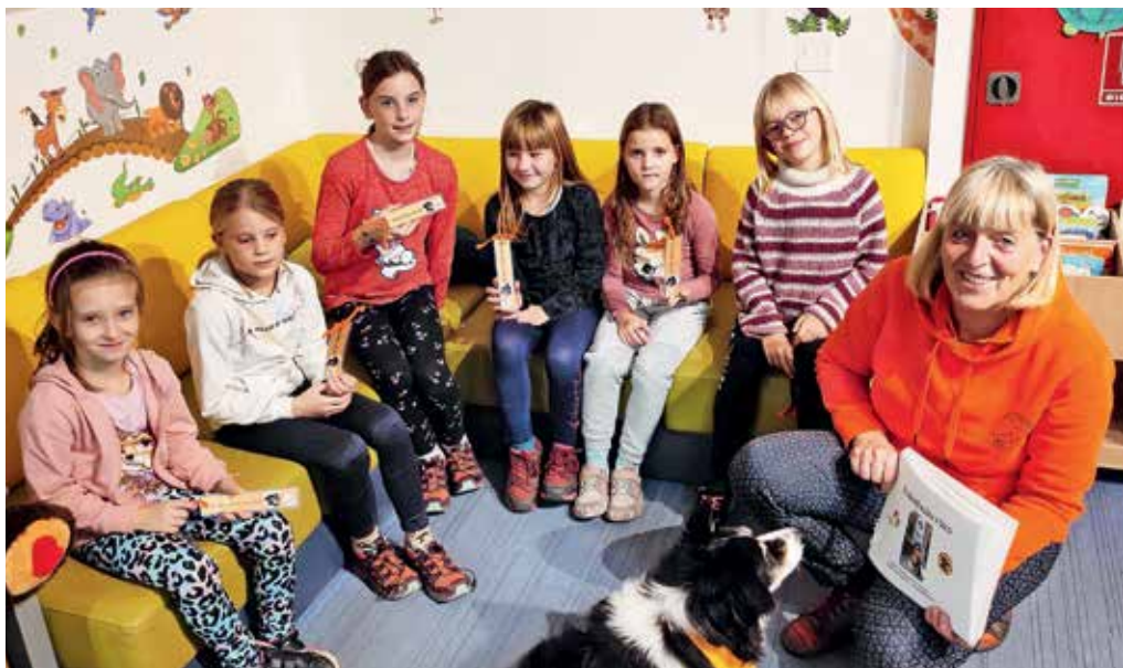
Pravljčna urica s kužkom