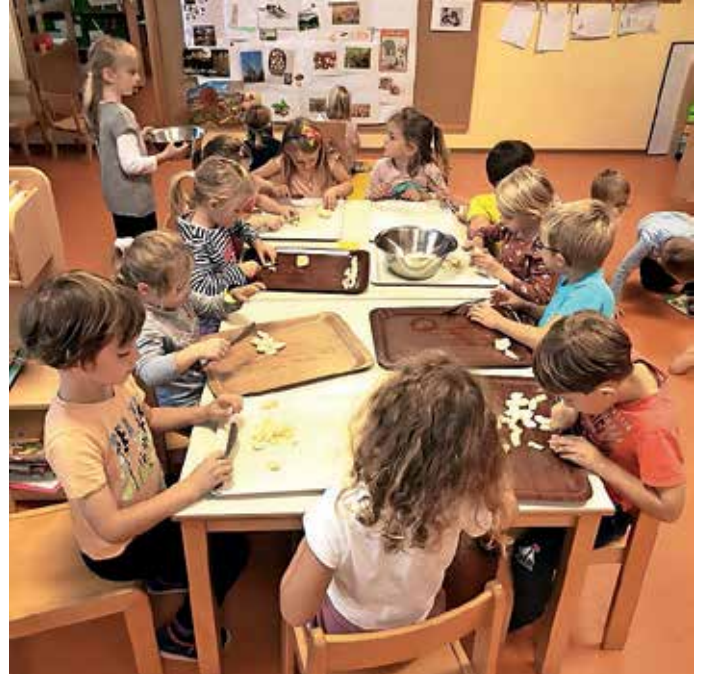
Iz jabolk z vrta v vrtcu pripravljajo različne dobrote.

Nam pa ta kotiček predstavlja vse in še več. Sprostitev, igro ki je otroška prioriteta, in naravo, ki je vedno bila in vedno bo naša največja inspiracija in zatočišče. Skozi celotno vrtčevsko leto sami skrbimo za zelenjavni vrt, kjer pridelujemo raznovrstno zelenjavo, zelišča in dišavnice. Pri tem sodelujejo tudi starši, saj nam doma vzgojene sadike radodarno podarijo. Otroci imajo radi stik z zemljo, radi sadijo, sejejo, opazujejo rast in razvoj rastlin. V vročih dneh te tudi zalivajo in jih z veseljem okušajo. Kar pridelamo sami, je zlata vredno – in tega se ne da meriti v materialnem smislu. To otroci vedno bolj čutijo, na nas odraslih pa sloni odgovornost, da jih popeljemo v svet hvaležnosti, ljubezni do narave, sajenja različnih zelenjavnih in sadnih vrst. Ob pogledu skozi okna naših igralnic takoj opazimo tri velike jabolane. Te rastejo skupaj z nami, saj jih celo leto spremljamo in se z njimi veselimo. Pozimi služijo kot držala za ptičje hišice,