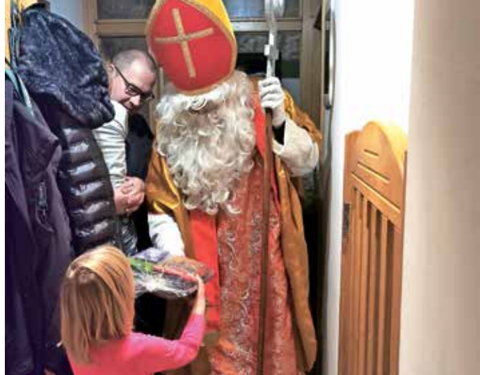
V Leskovicah je otroke Miklavž obiskal kar na domu.