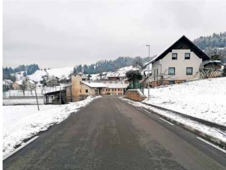
Prenovljeni odsek ceste Lučine–Suhi Dol

Tako se je najvišja točka ceste delno znižala, pred in za njo pa se je z dodatnim nasipom dvignila niveleta. Nova, sprejemljivejša višinska trasa ceste je za promet bistveno prijaznejša. Rekonstrukcija se je zaključila približno sto metrov pred križiščem v Suhem Dolu. »Ta odsek se bo rekonstruiral hkrati z rekonstrukcijo omenjenega križišča v Suhem Dolu.« Kot še pojasnjuje Igor Kržišnik, se je investicija glede na zahtevnejši teren od predvidenega po projektu in osnovnem pogodbenem popisu, v katerem niso bili upoštevani izkopi v kamnitem terenu, podražila. Končna vrednost del je tako 1.086.752,22 evra z vključenim DDV. Vrednost del na strani DRSI je višja za 141.882,98 evrov, občina pa bo dodatno plačala še 11.678,38 evrov z vključenim