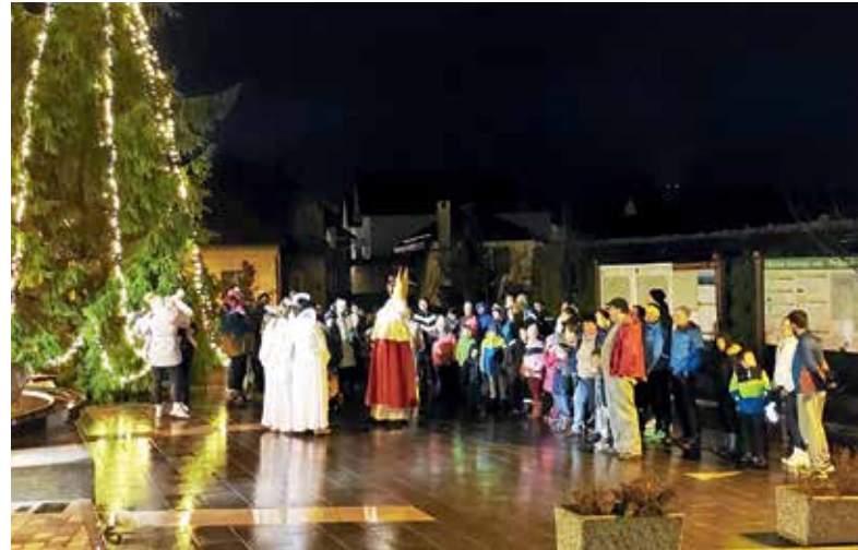
Miklavž v Gorenji vasi

V KS Javorje je ob pomoči TD Stari vrh od vasi do vasi potoval v spremstvu angelčkov in parkeljnov, se ustavil na petih točkah in obdaroval 117 otrok, ki so ga s pesmijo veselo pričakali. Miklavž se vsem, ki so pomagali, lepo zahvaljuje in pravi, da se bo zopet