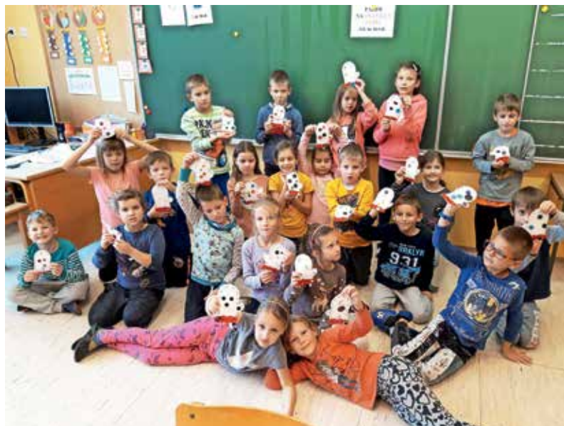
Drugošolci so šivali rokavičke.

Po tradicionalnem slovenskem zajtrku so učenci predmetne stopnje nadaljevali s tehniškim dnevom, katerega vsebine so bile prav tako namenjene zdravemu življenjskemu slogu in okolju: ekološkemu kmetijstvu, zdravi hrani, gibanju, zasvojenosti s sodobnimi tehnologijami pa tudi stereotipom, ki vplivajo na vsakega izmed nas. Učenci so se seznanili z novim izzivom, ki bo spodbujal gibanje ne le njih samih, ampak tudi učiteljev, staršev in drugih – osemtedenski izziv zbiranja korakov. Za šestošolce in osmošolce je društvo safe.si – točka osveščanja o varni rabi interneta in mobilnih naprav za otroke, najstnike, starše in učitelje – izvedlo dve zelo aktualni delavnici: Zasvojenosti s sodobnimi tehnologijami za 6. razred in Spolni stereotipi in spletno nasilje za 8. razred. Učenci 7. in 9. razreda so poleg drugih dejavnosti poslušali predavanje in se pogovarjali o sestavinah energijskih pijač in posledicah njihovega uživanja. Vsi učenci so izdelali tudi modele sadja in zelenjave, ki so na koncu pristali v ličnih košarah – ustvarili so jih devetošol-