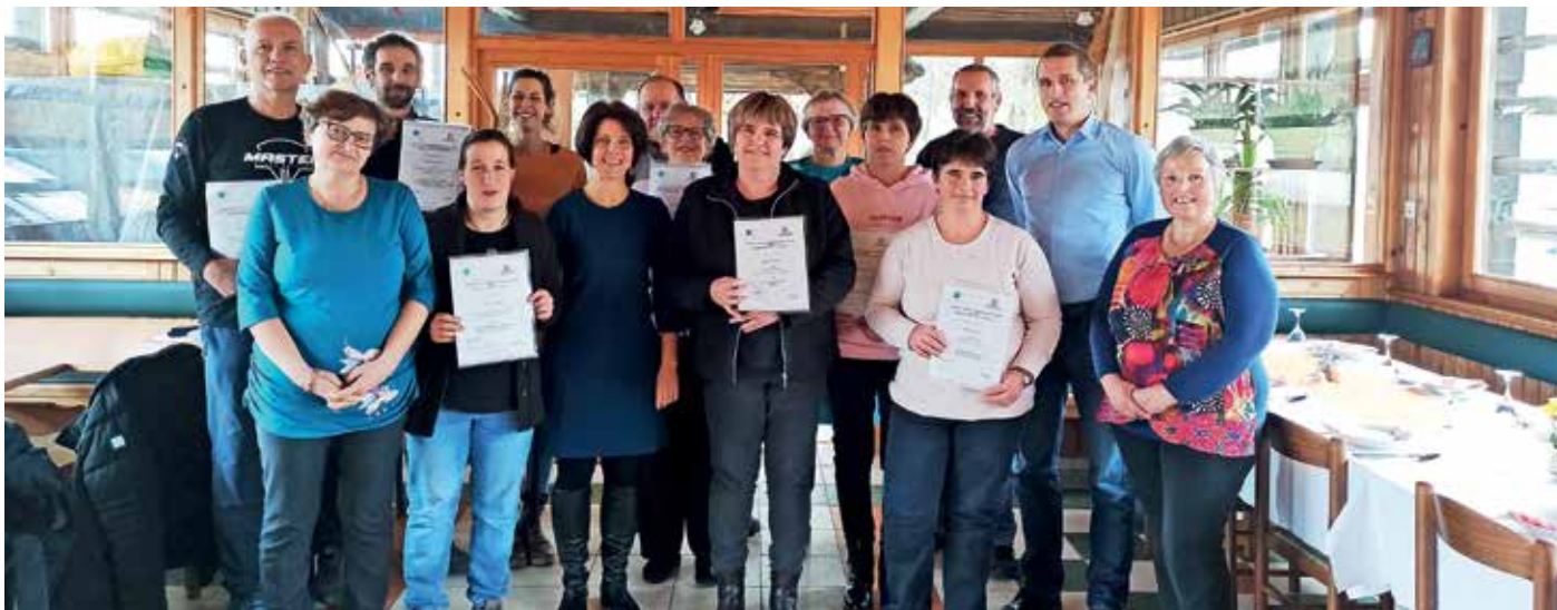
Ponudniki blagovne znamke na srečanju v Vinharjah

drugih projektov zadolžena sama. »Res je čas, ki ga lahko namenim blagovni znamki, omejen, tudi sredstev s strani občin je za ta projekt oziroma za razširjene aktivnosti premalo,« pove.