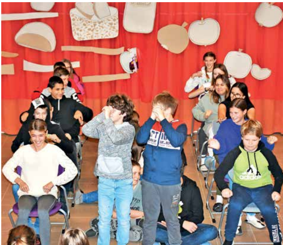
Prizor, ko Odisej z mornarji vesla proti otoku Kikloпов