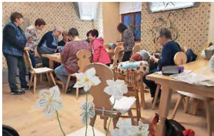
»Rožce« Cvetja v jeseni na delavnici klekljanja v kavarni Dvorca Visoko

»Bilo je tudi malo nostalgije po starih časih – spomini na otroštvo, ko so naše mame vezle ob dolgih zimskih večerih na topli peči.«