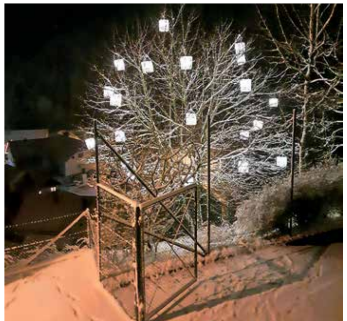
Z lampijoni okrašeno drevo na Sovodnju