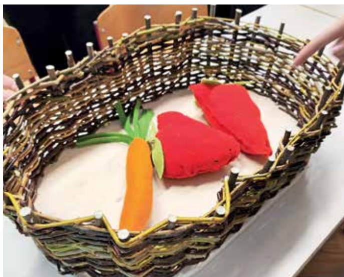
Vsi učenci so izdelali modele sadja in zelenjave.