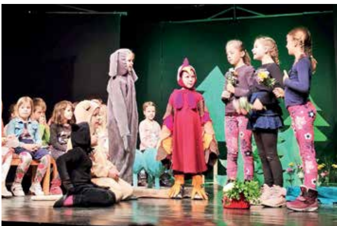
Na Sovodnju so otroke razveselili tudi z igrico.

Otroci iz Leskovice in okoliških vasi, Laz, Lajš, Robidnice, Krnic, Kopačnice, Studora, Debeni in dela Volake, so tudi letos nestrpno pričakovali prihod prvega od treh dobrih mož. Vse do leta 2020 so se otroci zbrali v Dvorani Leskovic in ga po krajšem kulturnem programu skupaj pričakali. Od leta 2020 dalje pa jih Miklavž v spremstvu angelov in parkeljnov obiše na domu. Dela je imel tudi letos veliko, saj je obiskal 33 otrok od prvega do desetega leta starosti in jim razdelil sladka in praktična darila.